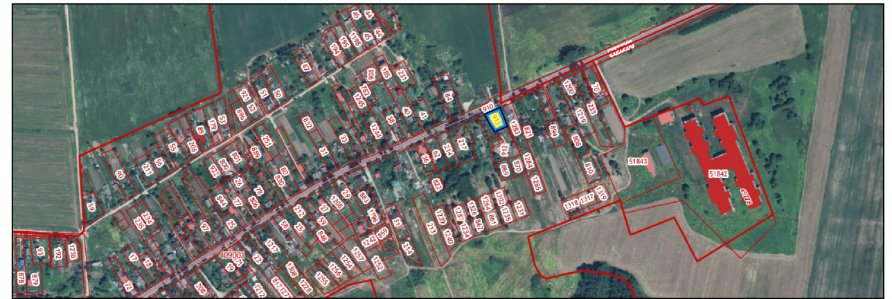
СХЕМА РАСПОЛОЖЕНИЯ ЗЕМЕЛЬНОГО УЧАСТКА В ОКРУЖЕНИИ СМЕЖНО РАСПОЛОЖЕННЫХ ЗЕМЕЛЬНЫХ УЧАСТКОВ (СИТУАЦИОННЫЙ ПЛАН) М 1:10 000