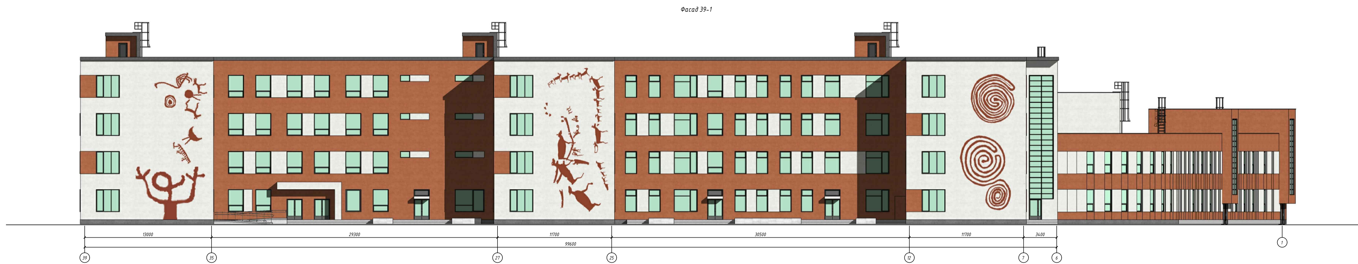
Ведомость отделки фасадов